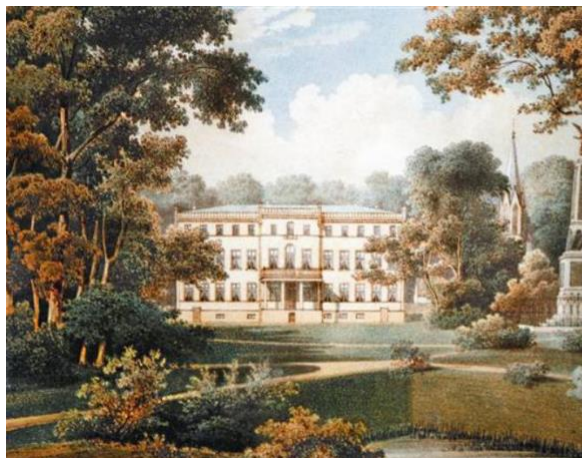
Pałac w Dąbroszynie ok. 1860 r.