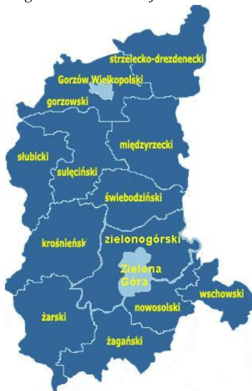
Powiat gorzowski na tle województwa lubuskiego

Obecny powiat gorzowski został utworzony z dniem 1 stycznia 1999 roku w ramach reformy administracyjnej. Powiat gorzowski leży w zachodniej części Polski, na północnym skraju województwa lubuskiego. Graniczy na północy z powiatem myśliborskim, na wschodzie z powiatami strzelecko-drezdeneckim i międzyrzeckim na południu z powiatem sulęcińskim, a na zachodzie powiatem marchijsko-odrzańskim (Niemcy). Powierzchnia powiatu wynosi ogółem 1.217 km 2 , co stanowi 8,7 % powierzchni województwa lubuskiego. Zamieszkuje go ok. 70 tys. osób, z czego 39% w miastach. Gęstość zaludnienia wynosi 58 osób na km 2 . Siedzibą władz powiatowych jest miasto wojewódzkie Gorzów Wlkp., które nie wchodzi w skład powiatu gorzowskiego.