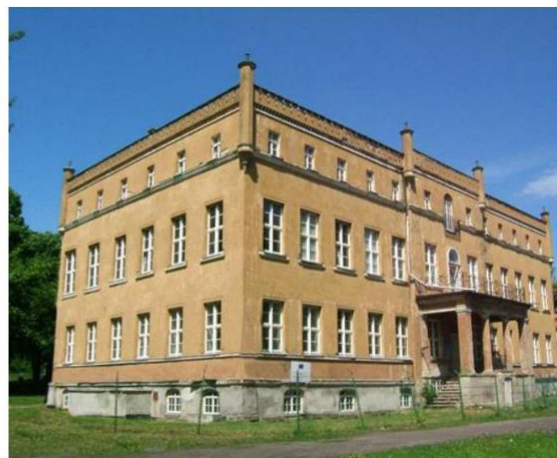
Pałac w Dąbroszynie stan obecny

Pałac w Dąbroszynie został wzniesiony w latach 80-tych XVII wieku w stylu barokowym. Budowla otrzymała formę prostopadłościenną, dwukondygnacyjną, z wysokim dachem dwuspadowym, o dwóch narożnych ryzalitach. Obiekt został wzniesiony z cegły ceramicznej na zaprawie wapiennej, o tynkowanych elewacjach. Ponad wejściem głównym umieszczono herb rodziny von Schöning. Elementem wystroju barokowej rezydencji są zachowane w kilku pomieszczeniach parteru barokowe dekoracje sztukatorskie, wykonane prawdopodobnie przez artystów saksońskich. Ostateczny kształt budowla uzyskała poprzez przebudowę w stylu neogotyckim w 1851 roku. Elewacje ukształtowano w sposób rytmiczny i symetryczny z prostokątnymi otworami okiennymi z opaskami, gzymsem cokołowym, podokiennym i koronującym. Bryłę zaakcentowano w narożnikach sterczynami. Z tego okresu zachowała się też stolarka okienna i drzwiowa. W latach 70-tych XX wieku wykonano z inicjatywy państwowego gospodarstwa rolnego kompleksowy remont elewacji pałacu. W latach 90-tych XX wieku założono piec centralnego ogrzewania. W ostatnich latach przeprowadzono kompleksowy remont polegający na adaptacji wewnątrz na cele hotelowe (wymieniono stolarkę okienną, schody oraz poddano konserwacji sztukaterie w pomieszczeniach parteru i piętra).